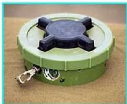
Рис.1 Общий вид мины ПМН-2

ПМН-2 Противопехотная мина нажимного типа